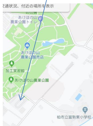
(あげぼの山農業公園本館前)